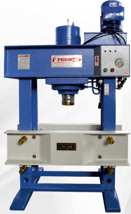
TEZGAH ÜSTÜ PRESLER ABOVE BENCH PRESSES