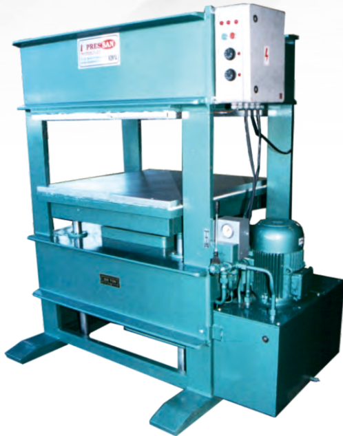
KLASÖR PRESLER FOLDER PRESSES