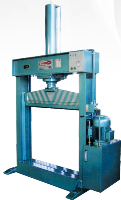
LASTİK KESME PRESLER RUBBER CUTTING PRESSES