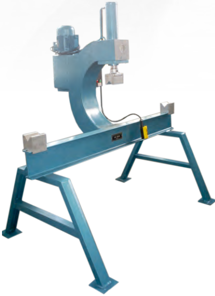
İSKELE BORU DOĞRULTMA PRESLER STRAIGHTENING PRESSES TUBE SCAFFOLDING