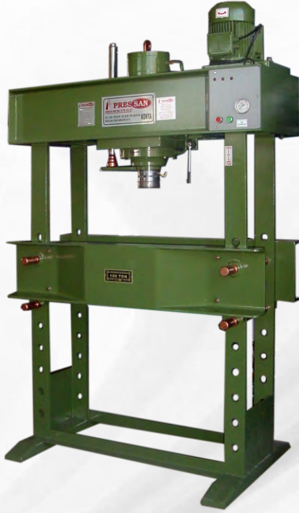
YATAKLAMALI ATÖLYE PRESLER GUIDING SHOP PRESSES