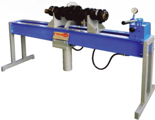
KRANK DOĞRULTMA PRESLER CRANKSHAFT STRAIGHTENING PRESSES