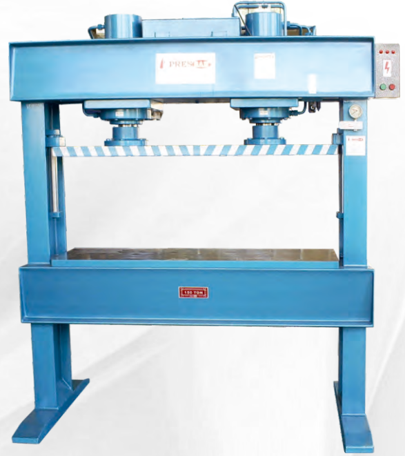
SAC DESEN PRESLER SHEET DRAWING PRESSES