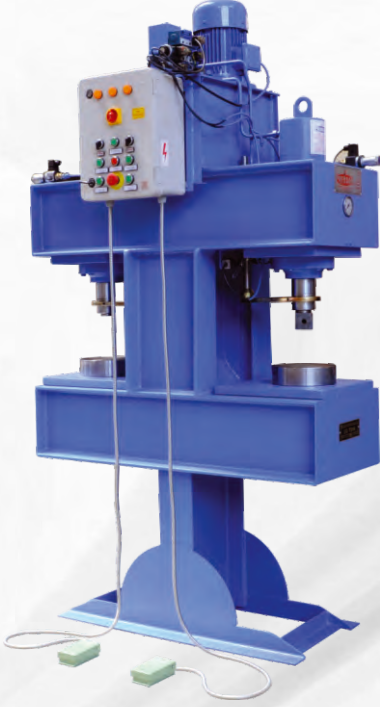
ÇİFT GÖZLÜ JANT MARKA PRESLER TWO WHEELS BRAND PRESSES SUNGLASSES