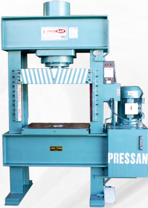
SOBA PRESLER STOVE PRESSES