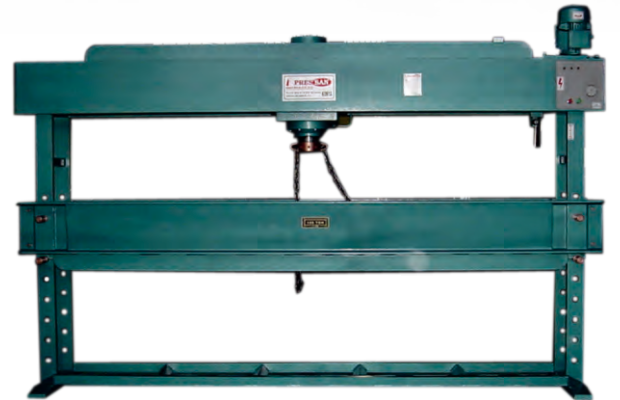
DORSE ve DİNGİL PRESLER DORS & AXLE PRESSES