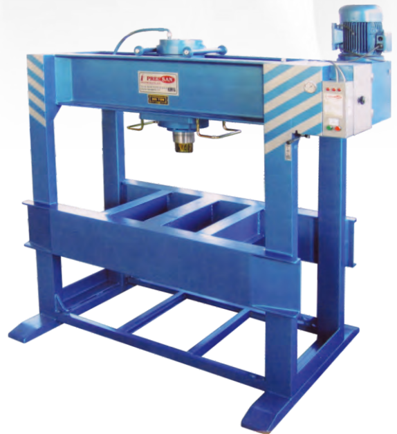
PLATİNE DOĞRULTMA PRESLER STRAIGHTENING TO PLATINUM PRESSES