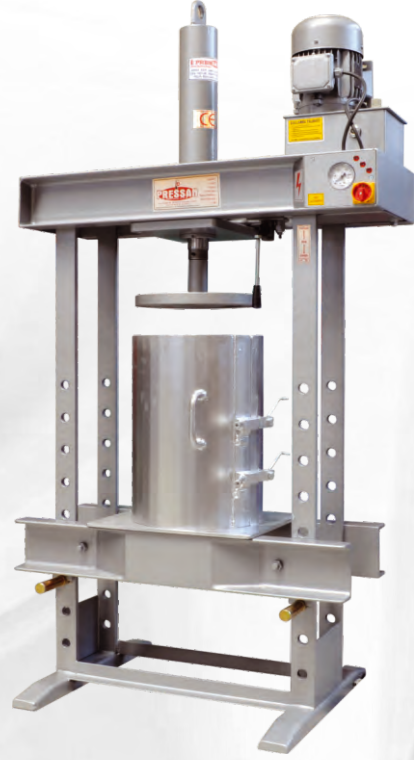
PEYNİR PRESLER CHEESE PRESSES